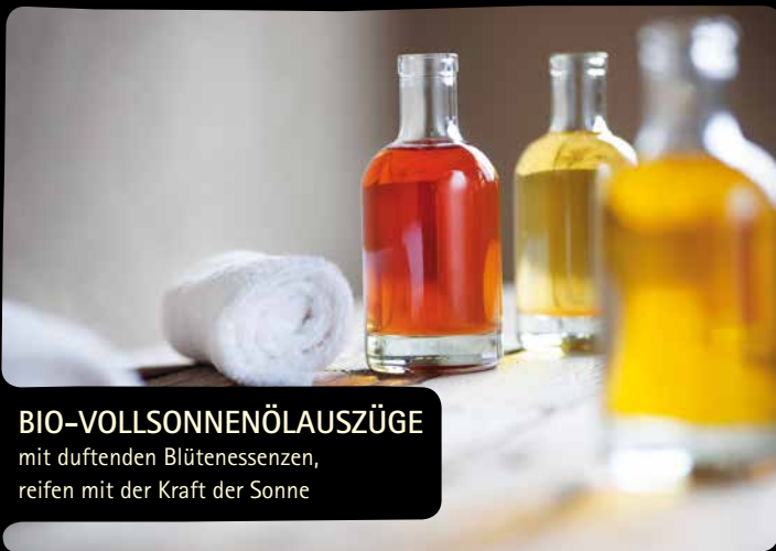
BIO-VOLLSONNENÖLAUSZÜGE mit duftenden Blütenessenzen, reifen mit der Kraft der Sonne